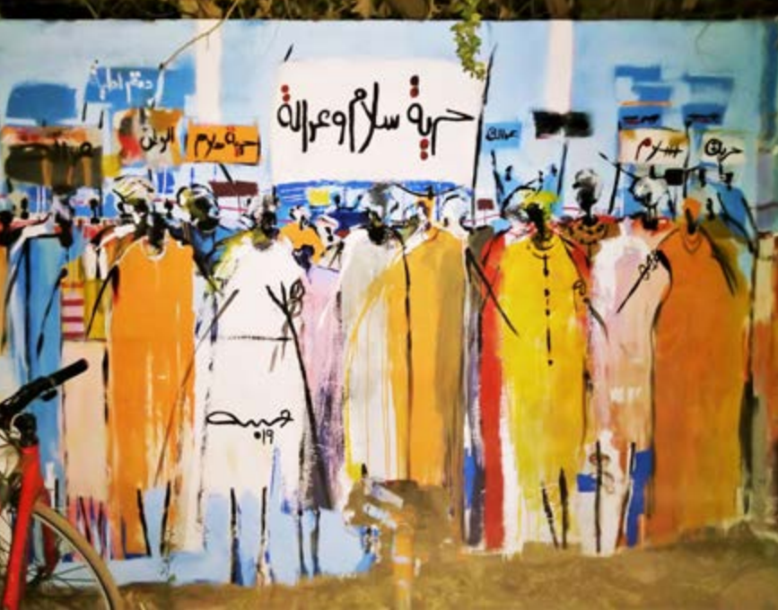
Foto links: Grafitti aus der Zeit der Revolution 2018/19, Künstler*in unbekannt. Auf den Schildern steht „Freiheit, Frieden, Gerechtigkeit“. Das Grafitti wurde inzwischen zerstört.