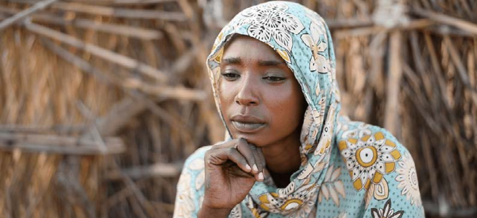
Foto: Interviewpartnerin aus dem Film „Forgotten Voices“