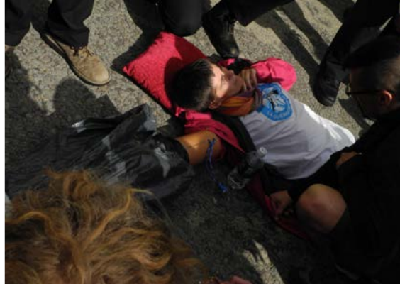
Foto links: Protest gegen ADEX in der Messehalle