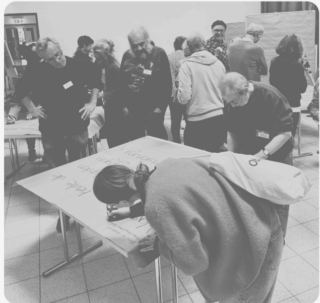
Teilnehmende des "Stillen World Cafés" auf dem Fachgespräch 2025