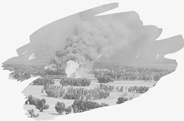
Brennende Ölquellen Kuwait 1991