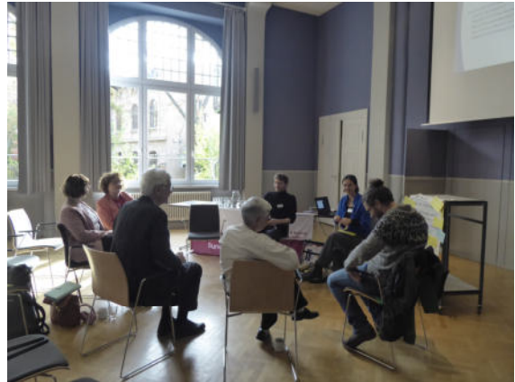
Die AG zu kommunaler Konfliktberatung.