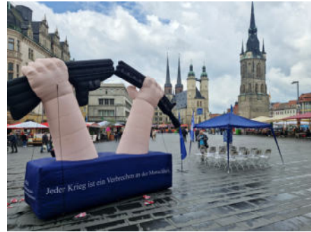
Das aufblasbare Zerbrochene Gewehr der DFG-VK in Halle.

Im Gegensatz zu westdeutschen Großstädten verfügt Halle nicht über leicht zugängliche Veranstaltungsräume. Stadtteilzentren etc. sind für Veranstaltungen kaum zugänglich. Zentrale, bezahlbare und bekannte Orte für Treffen und Veranstaltungen fehlen. Räume, wie beispielsweise der Pavillon in Hannover, die niedrigschwellig Angebote zur Teilhabe machen, fehlen schmerzhaft. Einzelne Gruppen haben eigene Räume, die sich besser oder schlechter eignen. Das führt auch dazu, dass im Vergleich zu anderen Städten weniger inhaltliche Veranstaltungen stattfinden und diese auf Events (kritische Einführungswochen an der Uni, Wochen gegen Rassismus des Bündnisses Halle gegen Rechts und andere) konzentriert bleiben.