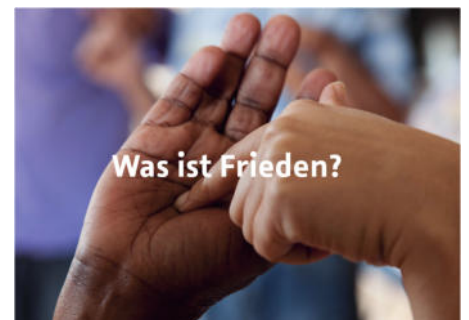
Postkarten des FK Halle