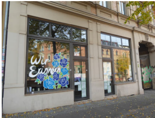
Das Tekiez von außen.

Ein Besuch beim Tekiez , der Gedenkstätte, die nach dem tödlichen Anschlag 2019 auf die Synagoge und einen Döner-Laden (heute das Tekiez) eingerichtet wurde, rundete den Tag ab. 2019 hatte ein rechtsextremistischer Attentäter zunächst versucht, in die Synagoge einzudringen, wo gerade Yom Kippur gefeiert wurde. Als er an der massiven Tür scheiterte, erschoss er eine Passantin und in einem nahegelegenen Döner-Imbiss einen Gast. Dort und auf seiner Flucht versuchte er, weitere Personen zu erschießen, und verletzte zwei davon schwer. Den Tatverlauf übertrug er per Helmkamera als Livestream. Überlebende des Anschlags haben darum gekämpft, den Imbiss als Gedenkstätte umzuge-