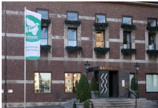
Beflaggung „Bürgermeister für den Frieden“ vor dem Düsseldorfer Rathaus während des russischen Einfalls in die Ukraine, 2. März 2022.

Eine der wichtigsten Aktivitäten ist der jährliche Flaggentag: Am 8. Juli jedes Jahres setzen bundesweit Bürgermeister*innen vor ihren Rathäusern ein sichtbares Zeichen für eine friedliche Welt ohne Atomwaffen. Damit appellieren sie an die Staaten der Welt, Atomwaffen endgültig abzuschaffen.