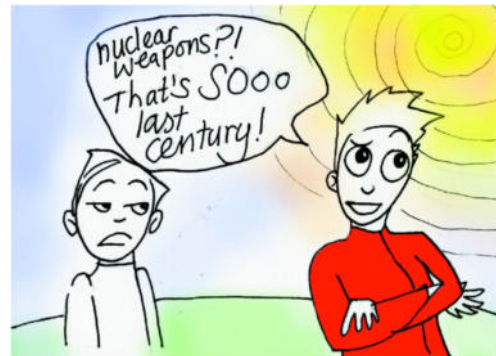
Cartoon: Charlotte Turtle, Wales © Presse-hütte Mutlangen

Er erinnert an das Rechtsgutachten des Internationalen Gerichtshofes (IGH) in Den Haag vom 8. Juli 1996. Es stellt fest, dass die Androhung und der Einsatz von Atomwaffen gegen die Prinzipien des humanitären Völkerrechts und damit gegen internationales Recht