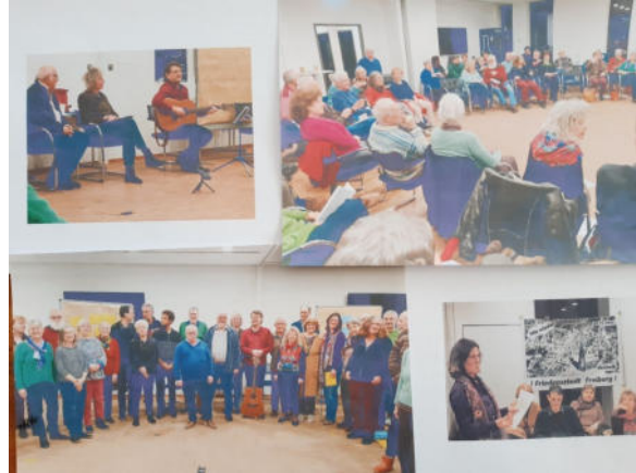
Gründungstreffen der Initiative.

Eine erste öffentliche Veranstaltung wurde am 22.2.2023 zum Jahrestag des militärischen