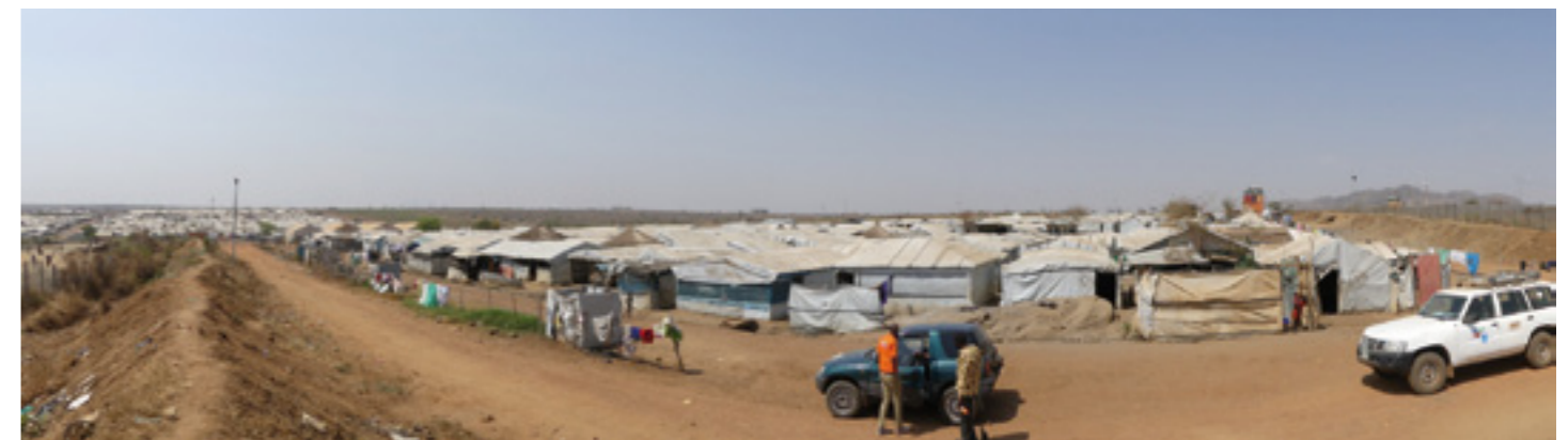
Ein Flüchtlingslager im Südsudan.