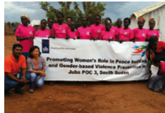
Das Frauenteam von Nonviolent Peaceforce in Juba, Südsudan.