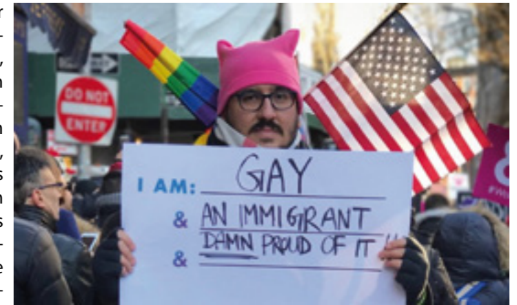
Anti-Trump-Demo in New York.

ein Problem der Vereinigten Staaten. Ob Duterte, Erdogan, Orban oder Wilders: Demokratien stehen am Scheideweg, der Populismus scheint auf dem Siegeszug. Was kann dagegen getan werden, wie kann man vorgehen?