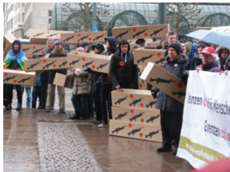
Rüstungsexporte sind ein wichtiges Thema für die Kirchen. Hier ein Protest im Frühjahr 2016 in Hamburg.