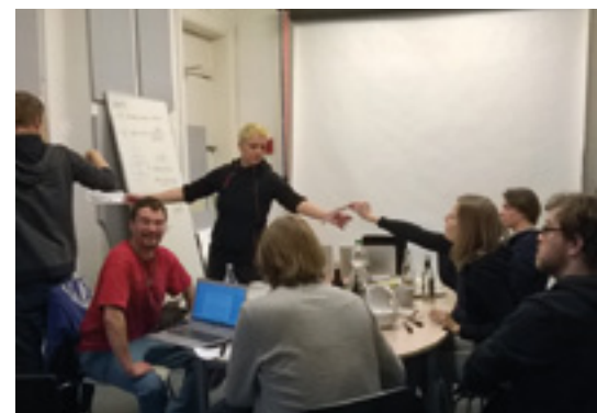
Das Team von Pudelskern und dem BSV-Bildungsprojekt bei der Entwicklung eines Kurzfilms zur Zivilen Konfliktbearbeitung.