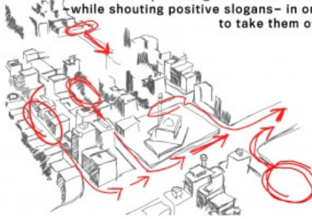
Bild 1: Gegen die Angst vor der Polizei: intelligente Massenmobilisierung. aus „How to protest intelligently“ http://www.indybay.org/newsitems/2011/01/29/18670645.php

In Ägypten 2011 wurde nicht ausschließlich nach dem Gütekraft-Konzept gehandelt, aber diese Dokumente und andere Quellen zeigen, dass zumindest einige, die die Konfrontation mit dem Regime – teils jahrelang – vorbereiteten, wichtige Elemente davon kannten und zur Anwendung brachten. 85