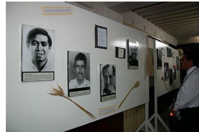
Foto: Ausstellung mit Fotos von Opfern.

Die Stiftung für forensische Anthropologie untersucht die Toten, die gefunden werden, versucht ihre Todesursache festzustellen und, sofern möglich, sie zu identifizieren. Das ist ein wichtiger Beitrag zur Aufarbeitung der Vergangenheit, denn die Angehörigen haben endlich Gewissheit.