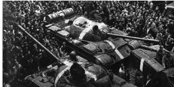
Prag 1968.