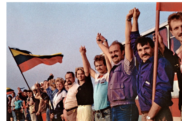
Menschenkette in den baltischen Ländern 1989. Die Unabhängigkeit wurde gewaltfrei erkämpft.

Herausgeber: Bund für Soziale Verteidigung e.V. Schwarzer Weg 8, 32423 Minden, Germany Tel.: +49 (0)571 29 456, Fax: +49 (0)571 23 019 info@soziale-verteidigung.de www.soziale-verteidigung.de