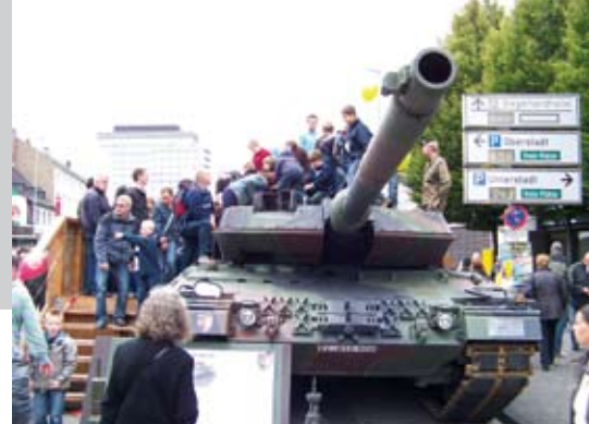
Panzer sind keine Spielzeuge - oder doch?

die Initiative Bundeswehr wegtreten unter www.bundeswehr-wegtreten.org . Interveniert wird zum Beispiel bei Rekrutierungsveranstaltungen, um das Streben der Bundeswehr nach gesellschaftlicher Akzeptanz und ihren Versuch der Selbstinszenierung einzudämmen.