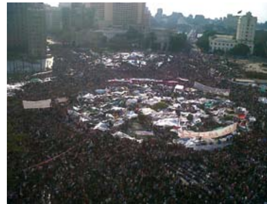
Der Tahrir-Platz in Kairo am 8.2.2011.