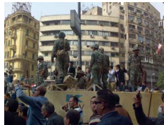
Demonstranten, Soldaten und gepanzerte Fahrzeuge in Kairo.