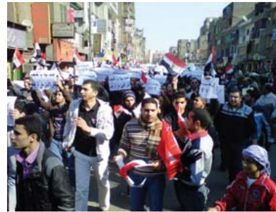
Ägyptische Demonstranten mit Flaggen und „Raus“-Schildern.

Doch die Welle spektakulärer Erfolge in Georgien, Ukraine, Libanon und Kirgisien endete bald. Zum einen lernten die Regime schnell dazu und konnten die Mobilisierung angesichts der immer gleichen Struktur leicht durchkreuzen. Noch schwerwiegender war, dass in den meisten Ländern zentrale Bedingungen wie relativ freie Medien, stärkere Oppositionsparteien, vertrauenswürdige Meinungsumfragen etc. gar nicht existierten. Auch die Mittel ausländischer Geldgeber flossen sehr unterschiedlich. Die Förderung der Demokratie unterlag gerade während des Kriegs gegen den Terror den strategischen Interessen der USA. Die Regime in Ägypten, Usbekistan und Aserbaidschan konnten sich schon daher ganz sicher fühlen. Auch sonst haben sich die ausländischen Geber nicht gerade mit Ruhm bekleckert, da sie im Rausch des ukrainischen Sieges starken Druck auf ihre lokalen Partner ausübten, um das Erfolgsrezept ungeachtet aller lokalen Besonderheiten anzuwenden. Last but not least dadurch konnten viele Regime die anti-amerikanische Karte spielen und die Opposition als westliche Marionetten bloßstellen.